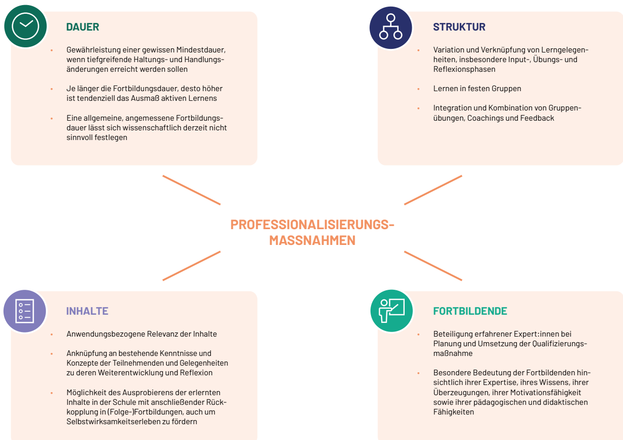
Abbildung 1: Faktoren der Wirksamkeit von Professionalisierungsmaßnahmen

Darüber hinaus wurde im Zuge der Recherchen und Interviews für dieses Impulspapier deutlich, dass verschiedene Begriffe wie Digitalisierung oder Digitalität benutzt, allerdings nicht klar voneinander abgegrenzt werden. Es liegt somit ein breit gefächertes Verständnis von Digitalisierung zugrunde, welches sich in den unterschiedlichen Definitionsansätzen der befragten Expert:innen ausdrückt.